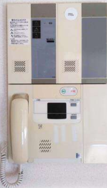
オートロック機械設備

室内でのお怪我や体調不良の際洋室・浴室・トイレに設置の緊急ボタンを押していただくと、警備会社へ繋がり、隊員が駆け付けます。